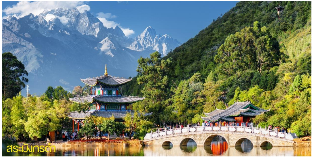
สระเมิงกร่า

นำท่านเดินทางสู่ เมืองโบราณลี่เจียง”ชมชีวิตความเป็นอยู่แบบโบราณที่ยังคงหลงเหลือให้ได้พบเห็นในเมืองนี้ภายในเมืองโบราณมีร้านของฝากของที่ระลึกมากมายและเมืองนี้ได้รับประกาศจากองค์การยูเนสโกให้เป็น “เมืองมรดกโลก”