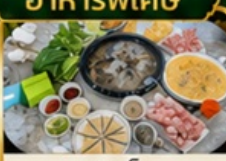
ชาพูเหิด