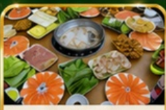
ชาพูแชลมอน