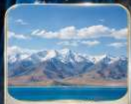
ทะเลสาบชิงไห่ (ไม่รวมรถกอล์ฟ)