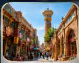
ตลาดอินบาชาร์

** เกี่ยวครบทุกวัน...ไม่ลงร้านช้อปปิ้ง **