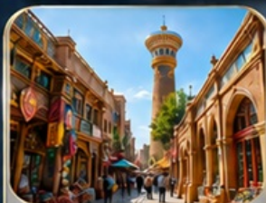
ตลาดอับบาชาร์

**เที่ยวครบทุกวัน...ไม่หลงร้านช้อปปิ้ง**