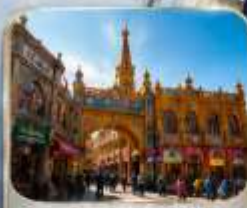
เมืองเก่าคาซการ์ (พิธีเปิดเมือง)