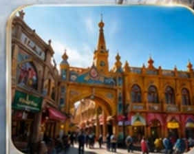
เมืองเก่าคาซการ์ (พิธีเปิดเมือง)