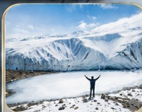
ธารน้ำแข็งมูซตาغاتา (รวมรถกอล์ฟ)