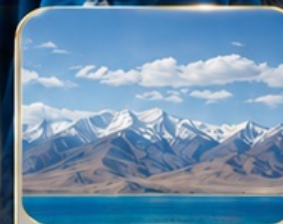
ทะเลสาบซิงไห่ (ไม่รวมรถกอล์ฟ)