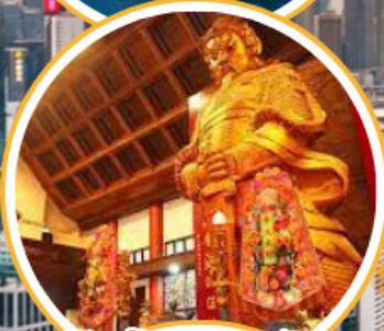
ไหว้พระวัดดั่ง