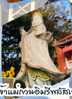
เจ้าแม่กวนอิมรัพลัสเบง