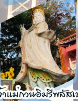
วัดอาม่า