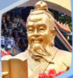
หวังต้าเซียน