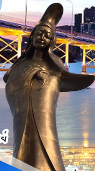
วัดอาม่า