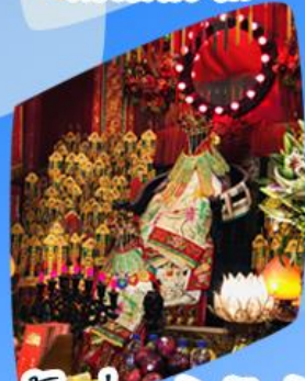
เจ้าแม่กวนอิมยิ้มเงิน