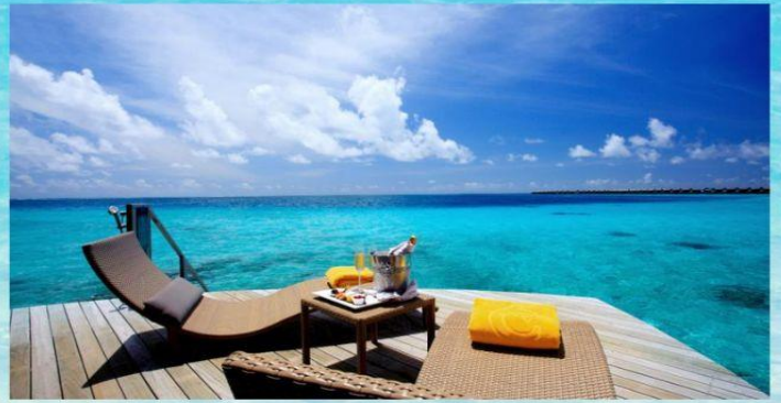
Room Type : Sunset Overwater Villa