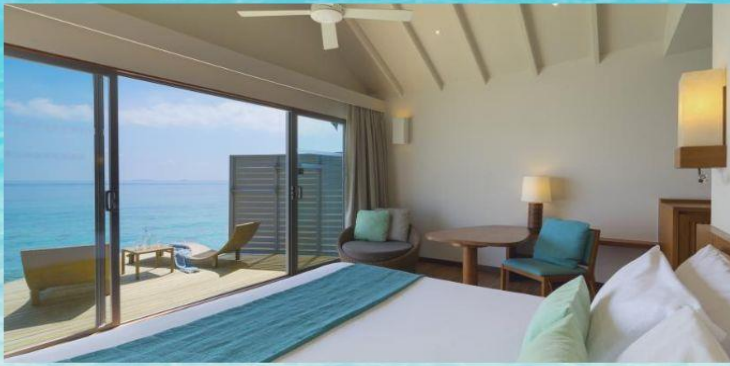
Room Type : Overwater Villa