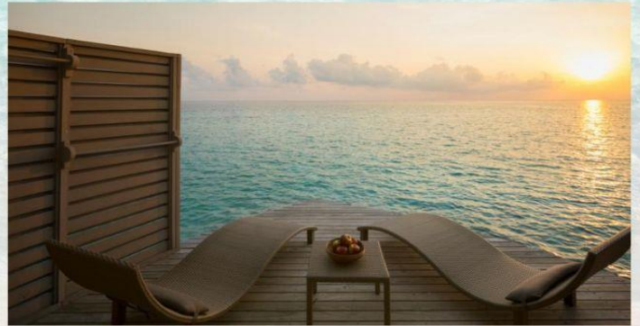
Room Type : Overwater Villa with Swirl Pool