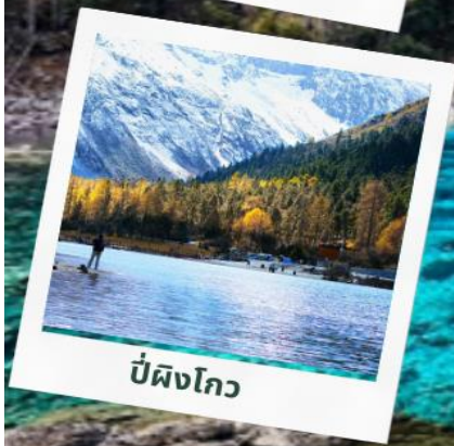
ปี่ผิงโกว