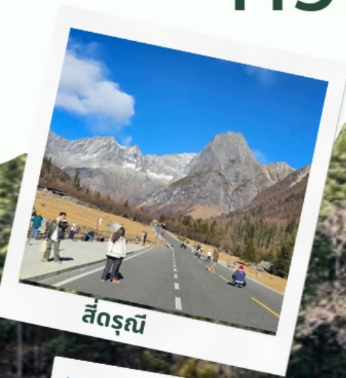
สี่ดรุณี