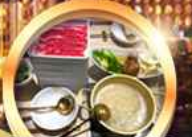
บุฟเฟ่ต์ชาบู เบือร์ไม่อิน!!