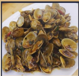
ผัดหอยลาย