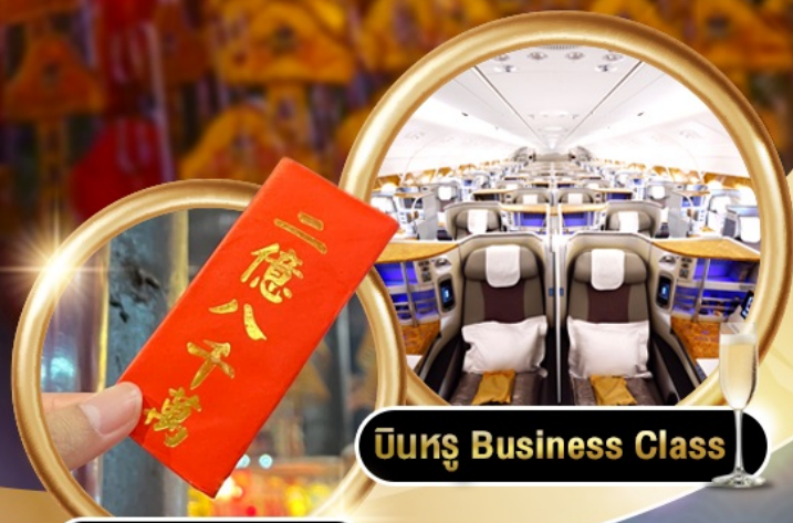
บินหรู Business Class