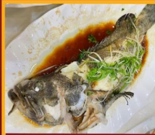
ปลาหนึ่งซีอิ๊ว