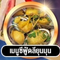
เมนูซีฟู้ดลิ้นยุบนุ่ม