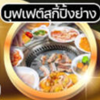
บุฟเฟ่ต์สุกี้ปิ้งย่าง