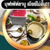
บุฟเฟ่ต์ชาบู เมื่อบริไม่อิน!!