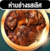
ท่าอย่างรสเลิศ