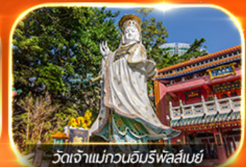
วัดเจ้าแม่กวนอิมรฟลัสเบย์

รวมตั๋วดิสนีย์แลนด์+รถรับ-ส่ง ซอปปิงแบบจัดเต็ม พักย่านจิมซาจุ่ย