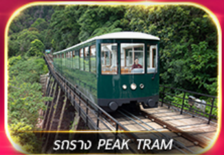
รถราง PEAK TRAM

เที่ยวสวนสนุกแบบจัดเต็ม ทั้งอิมบุงญ และ ซอปบิง จิมซาจู้ มงท็อก