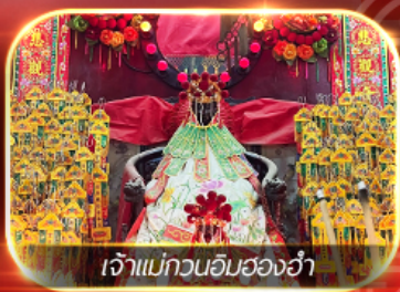
เจ้าแม่กวนอิมสองอ้า