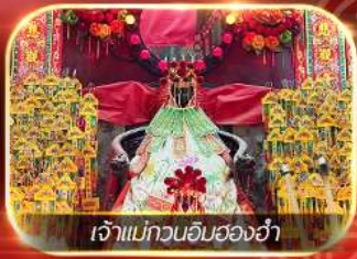
เจ้าแม่กวนอิมสองอ้า