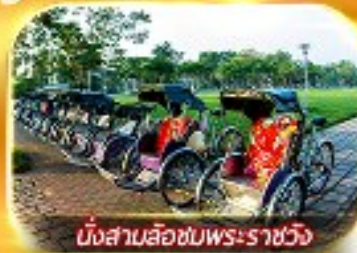
นั่งสามล้อชมพระราชวัง

สัมผัสความสวยงามหมู่บ้านสไตลฝรั่งเศสที่บานาฮิลล์ วัดเทียนมู่ พระราชวังเว้ สัมผัสเมืองโบราณฮอยอัน ล่องเรือกระดัง