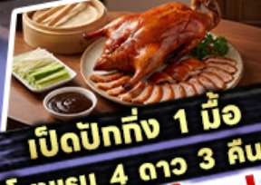
เปิดปักษ์ถึง 1 มื้อ

พักริองแรม 4 ดาว 3 คืน ไฮไลท์ สุดจ้าว! ขึ้นลิฟท์แก้วชมความอลังการ กลางหุบเขา