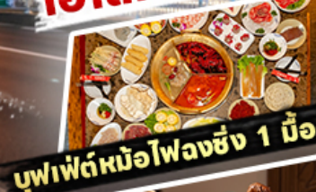
บุฟเฟ่ต์หม้อไฟลงชิง 1 มื้อ