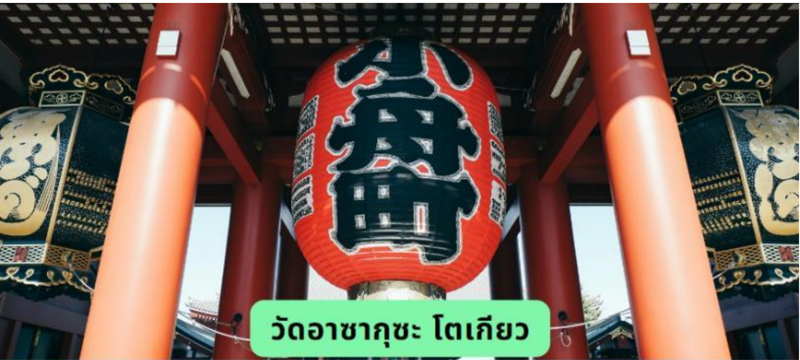
วัดอาซากุสะ โตเกียว