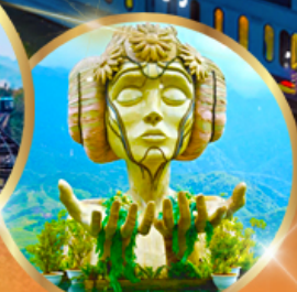
โมนาน่า คาเฟ่