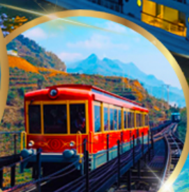
รถราง ซาปา