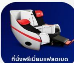
ที่นั่งพรีเมียมแพลตฟอร์ม

บริการอาหารร้อน และ น้ำดื่ม บนเครื่อง ขาไป และ ขากลับ