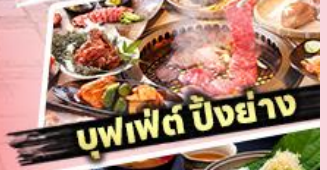
บุฟเฟต์ บิงยัง