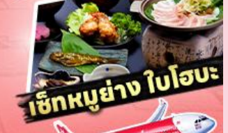
เช็ทหญ่ย่ง ใบโอบะ