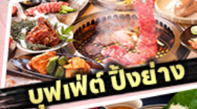
บุฟเฟต์ ปังย่าง