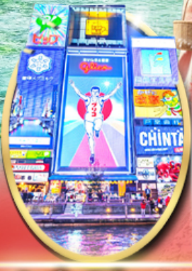
ซอปปิง ซินโซบาสึ