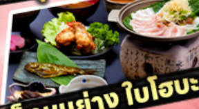
เช็กเมนูย่าง ใบโอบะ