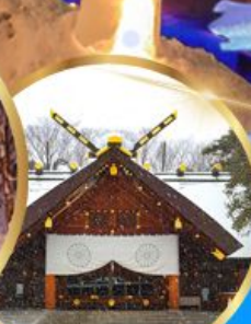
ศาลเจ้า ออกโทโต

เดินทาง 04 - 09 กุมภาพันธ์ 68 05 - 10 กุมภาพันธ์ 68