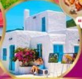
มารีนา คาเฟ่