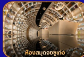
ห้างสรรพสินค้า