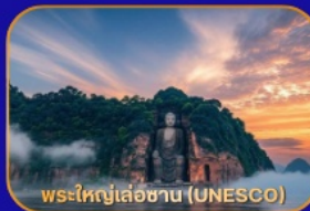
พระใหญ่เล่อซาน (UNESCO)