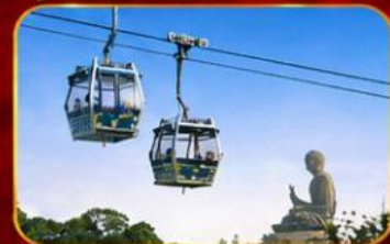
กระเชานองปิง