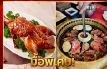
บ๊อฟเตซี่! เปิดอย่างอ่องกง บุฟเฟ่ต์ปึงย่างเกาสี