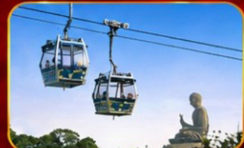
กระเช้านองปิง