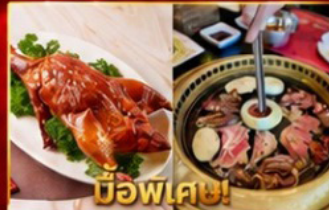
เปิดอย่างฮ่องกง บูฟเฟต์ปิ้งย่างเกาหลี