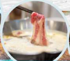
เมนูพิเศษ สุกี้หม่าล่า