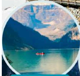
ทะเลสาบเตี๋ยซี