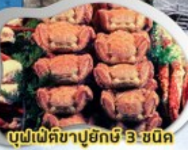
บุฟเฟ่ต์ขาปูยักษ์ 3 ชนิด