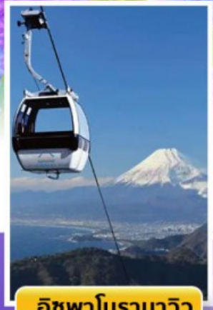
อีซูพานารามาวิว