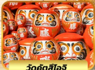
วัดคัตสึโงะ