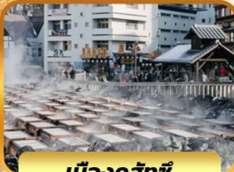
เมืองคุสัทชิ