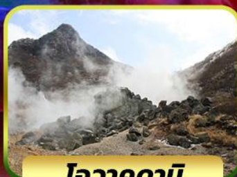
ไอวาคุดานึ