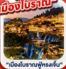
“เมืองโบราณฟูหรงเจิน”