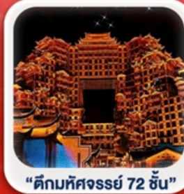
“ตึกมหัศจรรย์ 72 ชั้น”