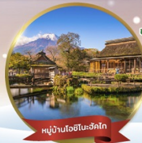
หมู่บ้านโอชิโนะฮักโกะ