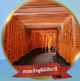
ศาลเจ้าฟูชิมิอินาริ