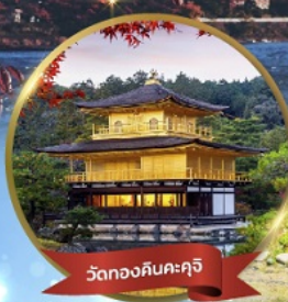
วัดทองคินคะคุจิ