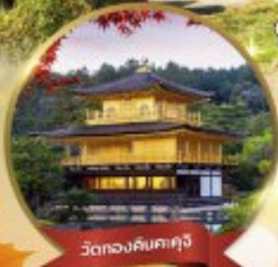
วัดทองคินคะคุจิ