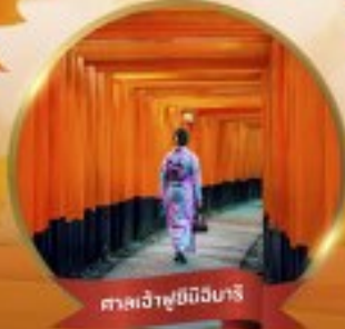
ศาลเจ้าฟูชิมิอิบาริ