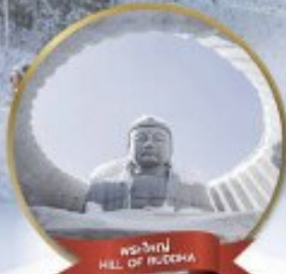
หุบเขา HILL OF BUDDHA