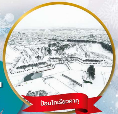
ป้อมโกเรียวกากุ