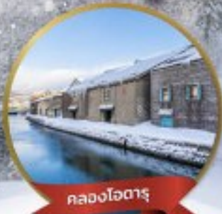
คลองไอตารุ