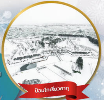
ป้อมโกเรียวกาคุ

หมู่บ้านนิงเกิลเกอเรส • สวนสัตว์อาซาฮิยาม่า • ชมขบวนพาเหรดเพนกวิน ตลาดเช้าฮาโกดาเตะ • ป้อมโกเรียวกาคุ • นั่งกระเช้าชมเมืองฮาโกดาเตะ ลานสกี • HILL OF BUDDHA • ไอตารุ • คลองไอตารุ • หมู่บ้านราเมน