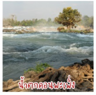
น้ำตกคอนพะเพ็ง