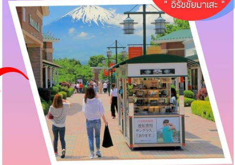
โกเทมบะ เอาก์เลท