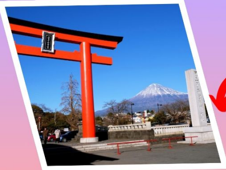
ศาลเจ้าฟูจิเซ็นเก็น