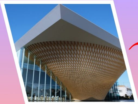
พิพิธภัณฑ์ ฟูจิกลับหัว