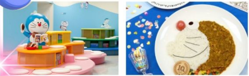
พิพิธภัณฑ์ฟูจิโอะ ฟูจิโกะ