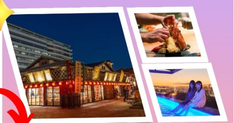
จุดเช็คอินใหม่ TOYOSU SENKYAKU BANRAI