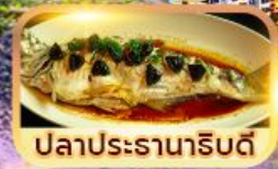
ปลาประธารานิดี