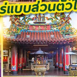
ศาลเจ้าจื่อหนานกง