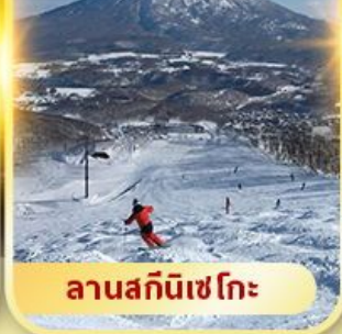
ลานสกีนิเซโกะ