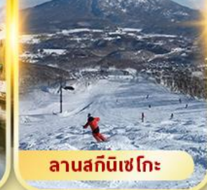
ลานสกีนิเซโกะ