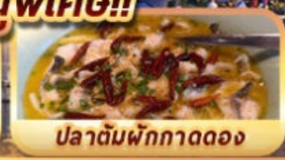
ปลาต้มผักกาดดอง