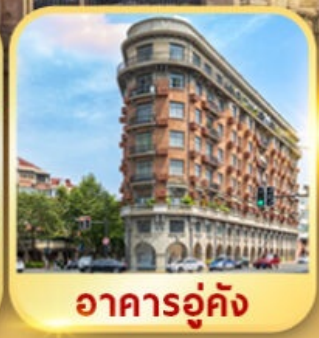
อาคารอู๋คัง