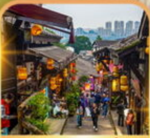
หมู่บ้านโบราณฉือซีโซ่ว