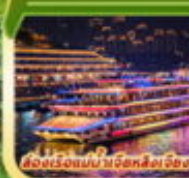
ส่องเมืองยามค่ำคืนที่ลี้ลับ