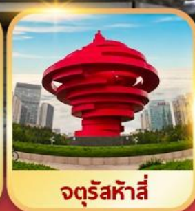
จตุรัสหาลี่