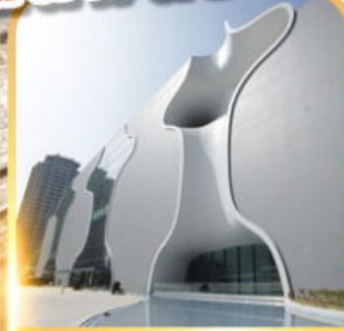
โรงละครไถจง