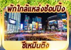
พักใกล้แหล่งช้อปปิ้ง ซีเหมินติง