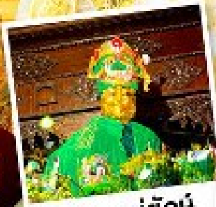
ซอพรแม่ยักย์