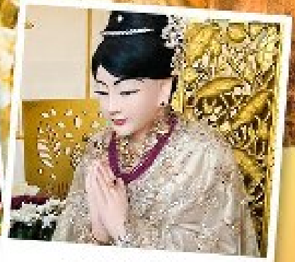
เทพกระซิบ