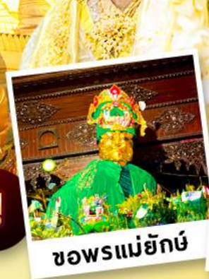
ขอพรแม่ยักย์