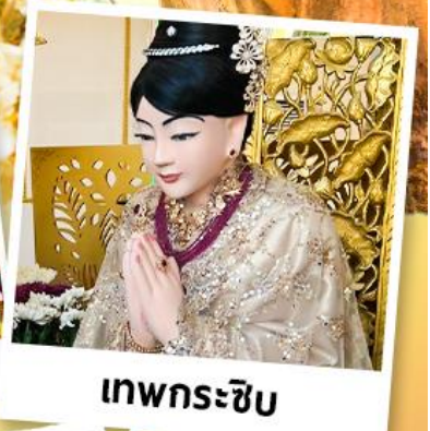
เทพกระซิบ