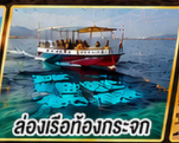
ล่องเรือท้องกระจก