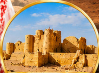
กลุ่มปราสาททะเลทราย (Desert Castles)