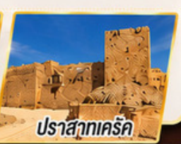
ปราสาทเคิร์ค