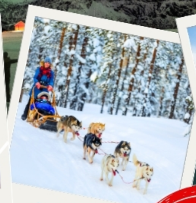
สุนัขฮัสกีลากเลื่อน