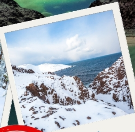
เทอริเบอก้า