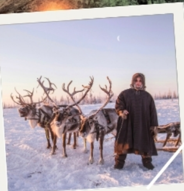
เมืองก็รอฟสค์