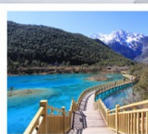
ไป๋สุ่ยเหอ