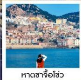
หาดซาจื่อฮั่ว