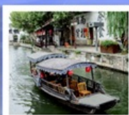
เมืองโบราณหนานสวิน